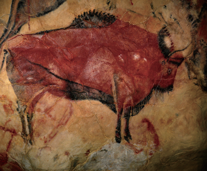
阿尔塔米拉山洞的野牛图

所以当他们在画画的时候，洞穴里非常暗。那么，他们为什么一定要画画呢？我们常把美丽的画挂在墙上作为装饰，但是洞穴里太昏暗了，穴居人的这些画应该不只是装饰品。