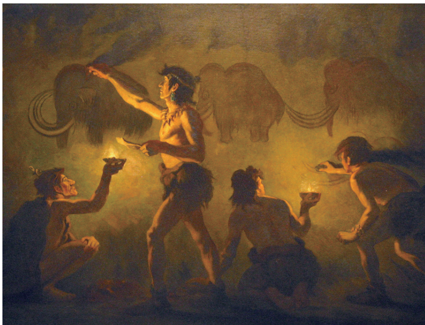
描述穴居人创作猛犸的作品

数数；猴子学会了用杯子喝水；鸚鵡学会了像人一样说话。不过，画画是只有人类才会的。